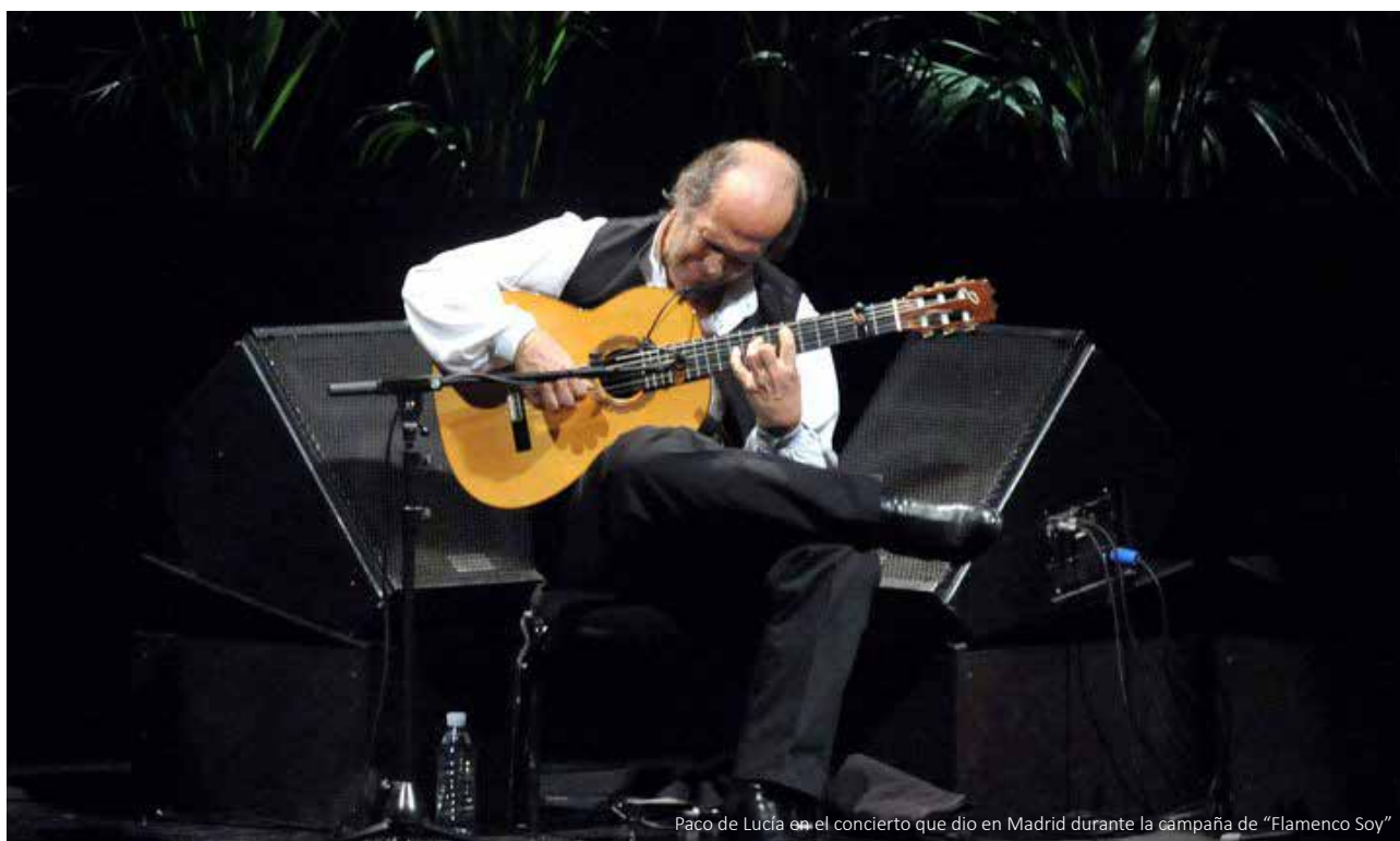
Paco de Lucía en el concierto que dio en Madrid durante la campaña de "Flamenco Soy"

Analizando este disco de una forma más individual me centraré solo en el primer tema, La cañada . Lo que más sorprende de estos tangos es la afinación novedosa que utiliza Paco para ejecutarlos. La 6ª cuerda está en La/A, consiguiendo un grave de octava baja de apoyo para la 5ª cuerda, con lo que logra un ambiente impresionante. La 1ª cuerda la pone en Re/D y la 2ª cuerda en La/A. Con la posición del acorde de Lam consigue tener el acorde fundamental del modo alterado con seis notas, sin tercera,