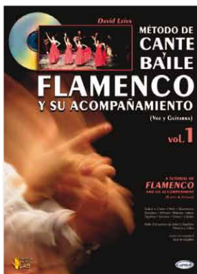
ML2854 - MÉTODO DE CANTE Y BAILE FLAMENCO VOL. 1 + CD