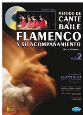
ML2910 - MÉTODO DE CANTE Y BAILE FLAMENCO VOL. 2 + CD