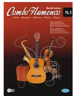
ML2932 - COMBO FLAMENCO VOL. 1